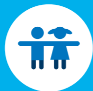
DETI – NAŠA BUDÚCNOSŤ